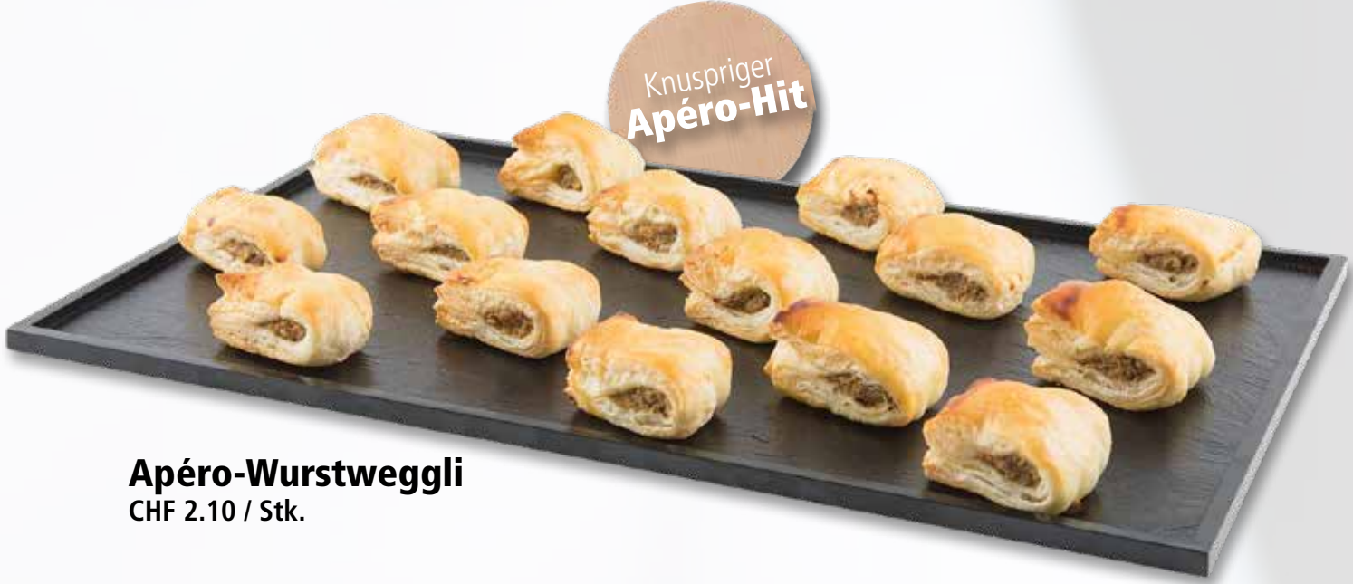
Apéro-Wurstweggli CHF 2.10 / Stk.