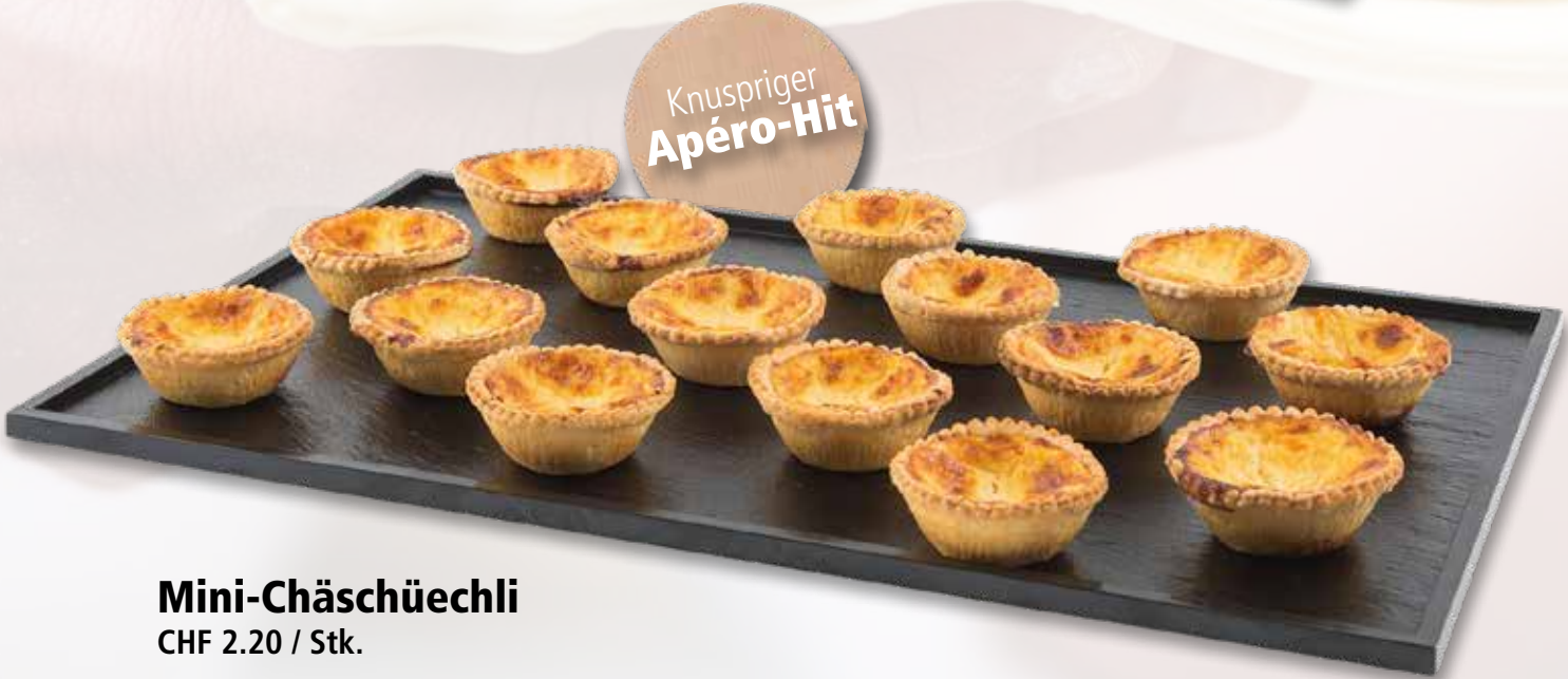
Mini-Chäschüechli CHF 2.20 / Stk.