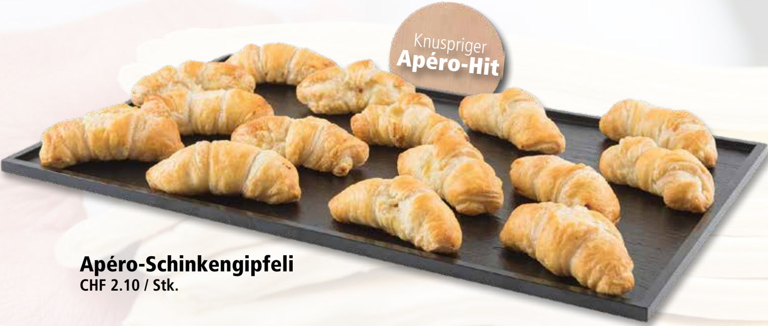
Apéro-Schinkengipfeli CHF 2.10 / Stk.