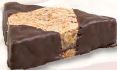
* Nussecke CHF 2.60