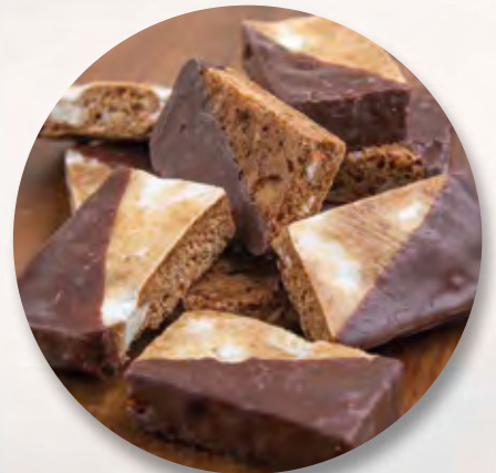
Schoggi-Läckerli, 100 g CHF 6.50 150 g CHF 9.50 / 300 g CHF 16.50