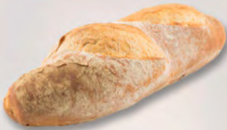
Basler Ruchbrot, 1 kg CHF 5.10