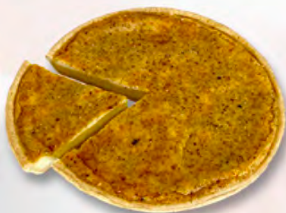
* Käsewähe 1/6 CHF 4.50 / 28 cm 27.–