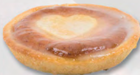
Holländertörtli, 9 cm CHF 3.20