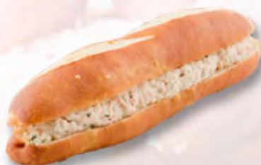
Silserli mit Thon (MSC) CHF 2.90