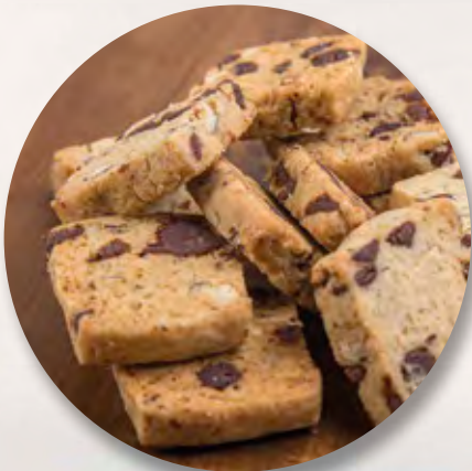
Schoggichnusperli, 150 g CHF 6.–