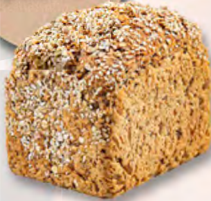
Eiweissbrot, 450 g CHF 4.20