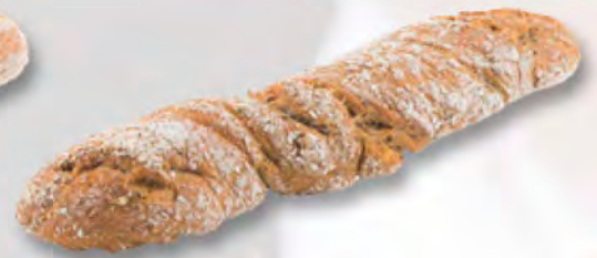
Chnurzelbrot rustico, 370 g CHF 4.20