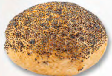
Brötchen mit Mohn CHF 1.25