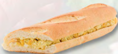
Rosmarin-Baguette mit Poulet-Curry (CH) CHF 6.95