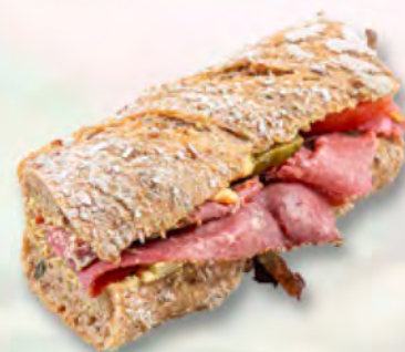
* Chnurzel-Rusticosandwich mit Rindspastrami CHF 6.80