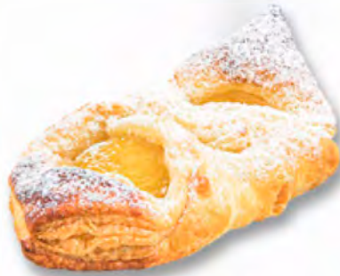
* Aprikosentasche CHF 2.80