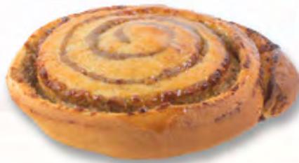
* Hefeschnecke CHF 2.90