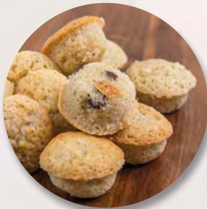
Surprisli, 150 g CHF 6.90