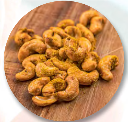
Curry-Cashewnüsse, 100 g CHF 4.30