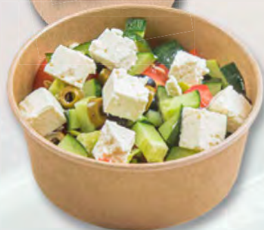
* Griechischer Salat CHF 7.95