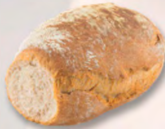
Basler Ruchbrot, 500 g CHF 3.50