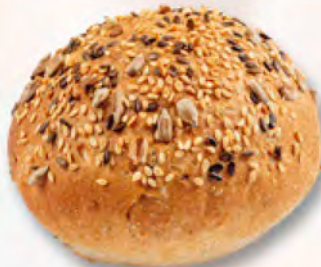
Brötchen mit Kernen CHF 1.25