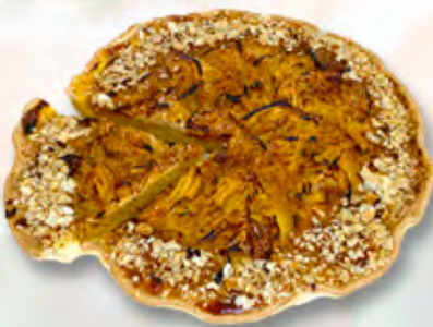
* Apfelwähe mit Karamell 1/6 CHF 4.50 / 28 cm CHF 27.–

*Angebot kann der Saisonalität entsprechend ändern. Fragen Sie uns – wir geben Ihnen gerne Auskunft.