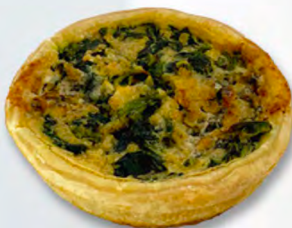
Spinatkiechli, 10 cm CHF 4.50