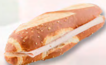
Silserli mit Fleischkäse CHF 2.90