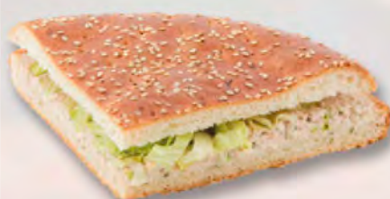
Rustico Pide mit Thon (MSC) CHF 5.80