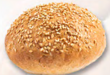
Brötchen mit Sesam CHF 1.25