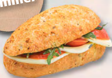
* Tigersandwich mit Tomaten, Büffelmozzarella und Pesto CHF 6.50