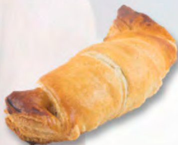
Schinkengipfeli CHF 3.50