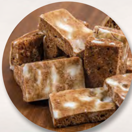
Läckerli, 100g CHF 5.50 150 g CHF 8.50 / 300 g CHF 14.40