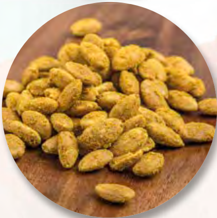
Curry-Mandeln, 100 g CHF 4.30