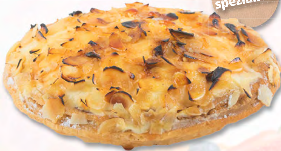
Birnenflambé CHF 3.80