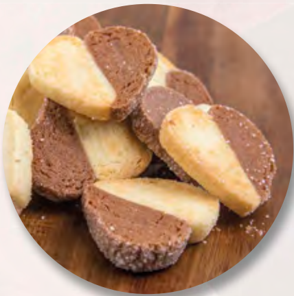
Sabléherz, 150 g CHF 6.15