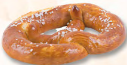
Laugenbretzel CHF 2.20