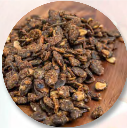
Gebrannte Kürbiskerne, 100 g CHF 5.20