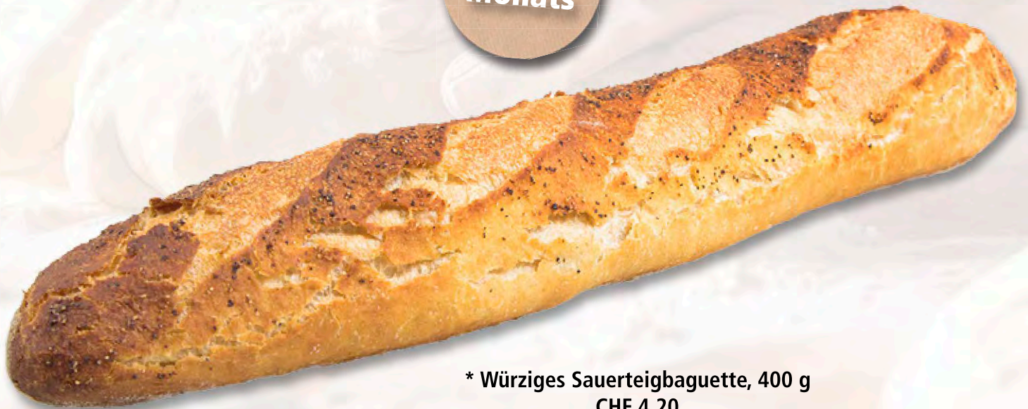
* Würziges Sauerteigbaguette, 400 g CHF 4.20