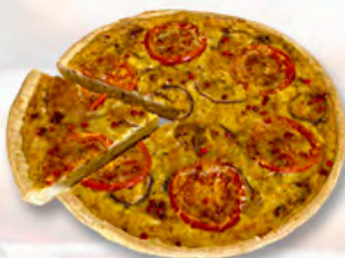
* Thon-Limetten-Wähe 1/6 CHF 4.50 / 28 cm CHF 27.–