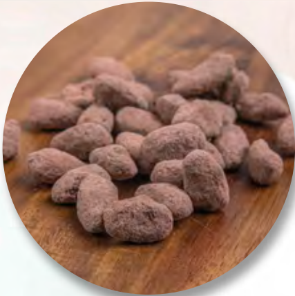
Schoggimandeln, 80 g CHF 6.30