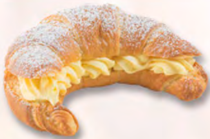
Vanillegipfeli CHF 3.80