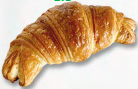
Buttergipfeli CHF 2.50