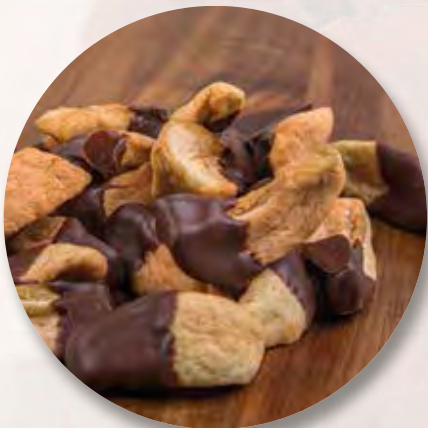
Schoggi-Äpfel, 100 g CHF 6.70