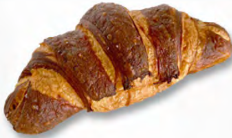
Laugengipfeli CHF 2.50