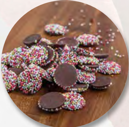
Non-Pareilles, 80 g CHF 4.30