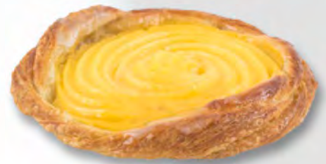
Dänischer Plunder CHF 3.20