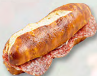
Silserli mit Salami CHF 2.90