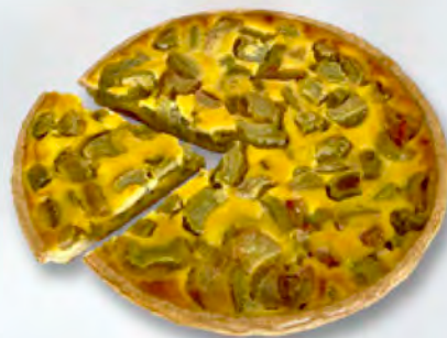
* Rhabarberwähe 1/6 CHF 4.50 / 28 cm 27.–