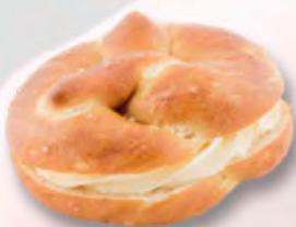
Silserli mit Butter CHF 2.90