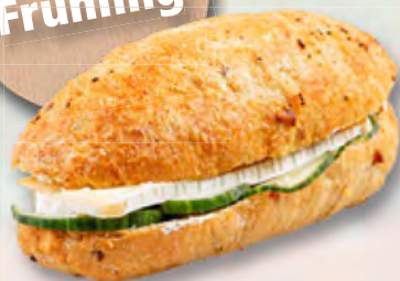
* Tigersandwich mit Camembert CHF 5.95