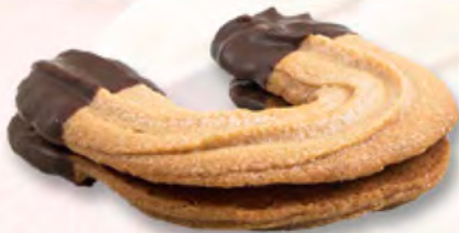
* Pralinéhörnli CHF 2.60