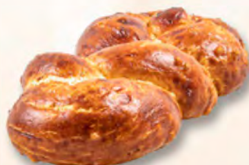
Laugen-Minizöpfli CHF 2.20