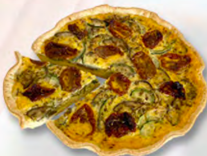
* Sommergemüsetarte 1/6 CHF 4.50 / 28 cm 27.–