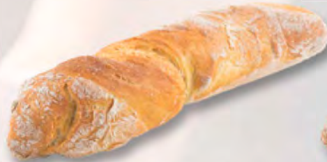
Chnurzelbrot hell, 370 g CHF 4.20