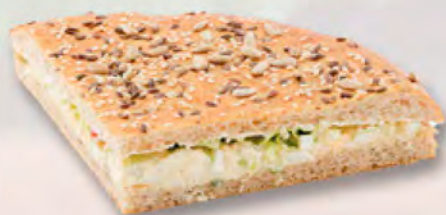
Rustico Pide mit Ei (CH) CHF 4.95