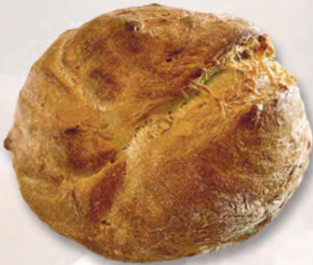
St. Galler halbweiss, 500 g CHF 3.90