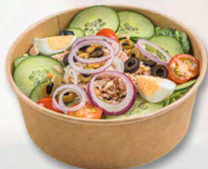
Salat mit Thon CHF 14.95