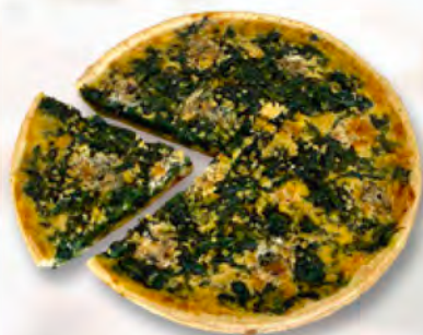
* Spinatwähe mit Roquefort 1/6 CHF 4.50 / 28 cm CHF 27.–