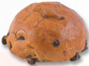
Schoggiweggli CHF 2.90