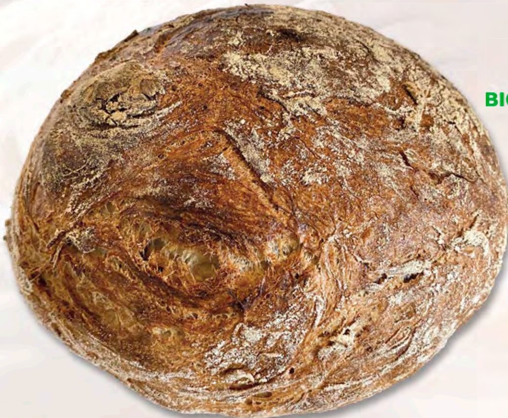
Bio Gourmet Knospe Almweizen 650 g CHF 6.90