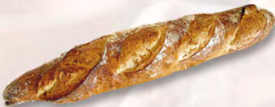
* Mildes Sauerteigbaguette, 400 g CHF 4.20