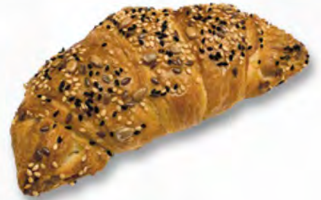
Rusticogipfeli CHF 2.50