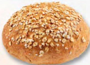
Brötchen mit Haferflocken CHF 1.25