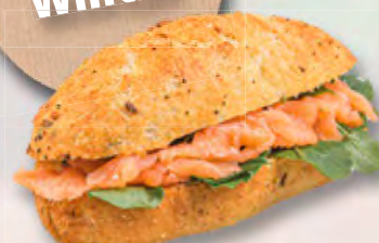
* Tigersandwich mit Rauchlachs (MSC) und Brunnenkresse CHF 6.50