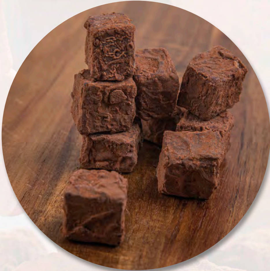
Pavé de Bâle 100 g CHF 7.20