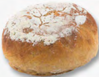
Urdinkelbrötchen dunkel CHF 1.30