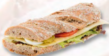
* Chnurzel-Rusticosandwich mit Gruyère AOP CHF 6.80