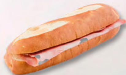
Silserli mit Schinken CHF 2.90