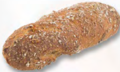
Chnuzelbrötchen rustico CHF 1.30