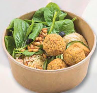
Mezze-Platte CHF 9.95