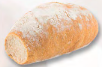
Basler Ruchbrot, 250 g CHF 2.50