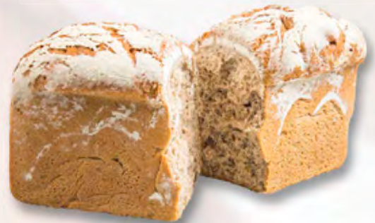
* Roggen-Sauerteigbrot, 500 g CHF 4.90