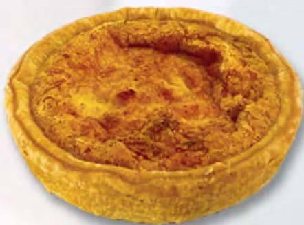
Käskiechli, 10 cm CHF 4.20