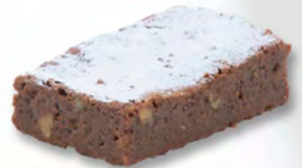
Brownie CHF 3.20