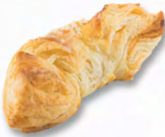
Mandelgipfeli CHF 3.40