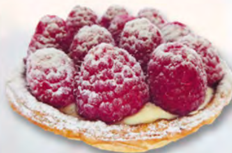
* Himbeertörtli CHF 3.80