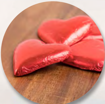
Schoggiherz CHF 1.50