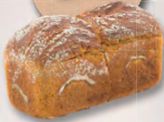
Urdinkel dunkel, 400 g CHF 4.30