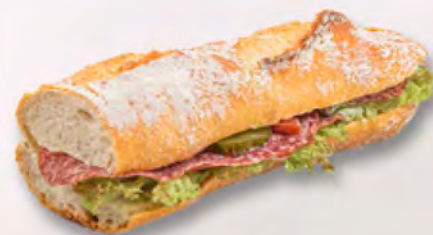
Baguette mit Salami CHF 7.20