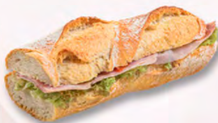
Baguette mit Schinken CHF 7.20