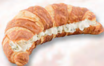
Laugengipfel mit Schnittlauchquark CHF 4.25