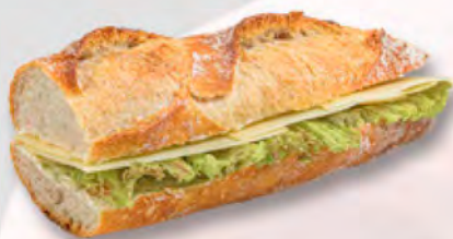
Baguette mit Gruyère AOP CHF 7.20