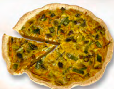
* Süsskartoffeltarte 1/6 CHF 4.50 / 28 cm CHF 27.–