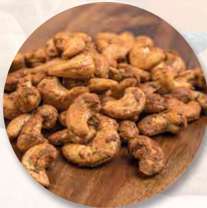
Chili-Cashewnüsse, 100 g CHF 4.30