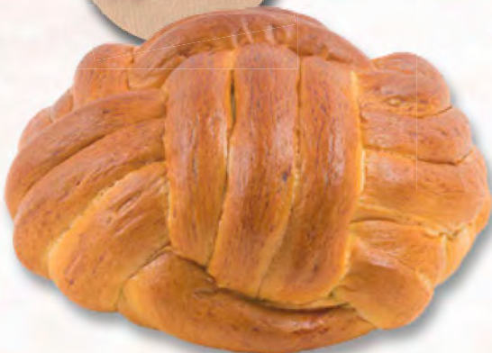
Winston Zopf, 420 g CHF 6.20