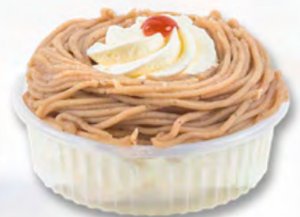
* Vermicelles CHF 3.80