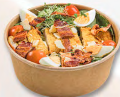
Caesar-Salat mit Pouletschnitzel (CH) CHF 12.95