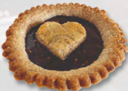
Linzertörtli, 9 cm CHF 4.20