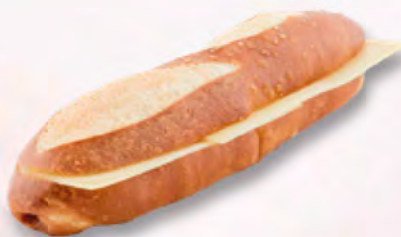
Silserli mit Gruyère AOP CHF 2.90