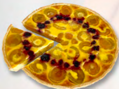
* Aprikosenwähe 1/6 CHF 4.50 / 28 cm 27.–