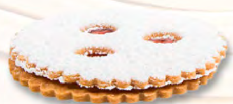
* Spitzbube CHF 2.60