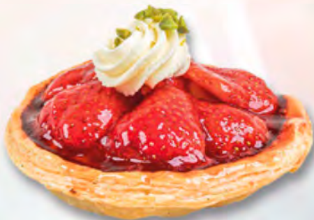
* Erdbeertörtli CHF 3.80