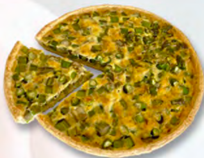
* Spargelwähe 1/6 CHF 4.50 / 28 cm 27.–