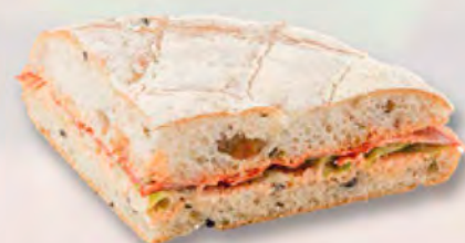
Olivenbrot mit Chorizo CHF 6.50