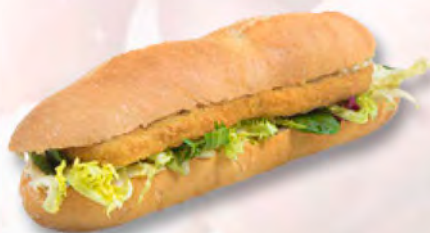
Schnitzelbaguette (CH) CHF 6.95