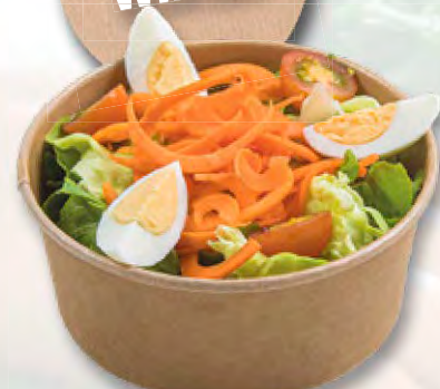
* Blattsalat mit Karottenspiralen und Ei CHF 7.95