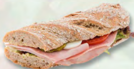
* Chnurzel-Rusticosandwich mit Schinken CHF 6.80