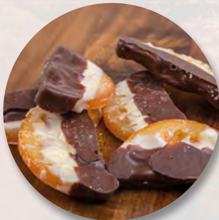
Schoggi-Orangen, 100 g CHF 6.90