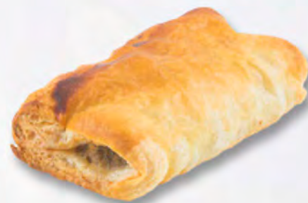
Wurstwegge CHF 3.50